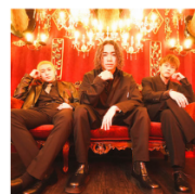
ローカルカンピオーネ