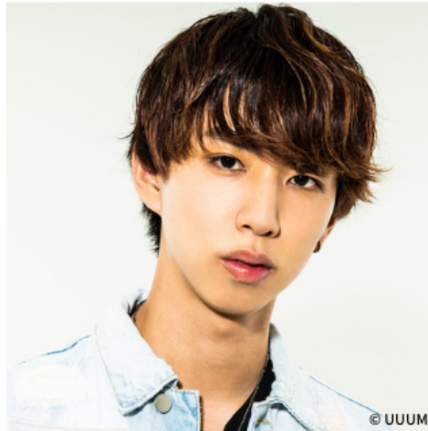
はじめしゃちょー

スペシャルゲストとして、YouTubeチャンネル登録者数1,030万人超の大人気クリエイター・はじめしゃちょーの出演が決定いたしました。