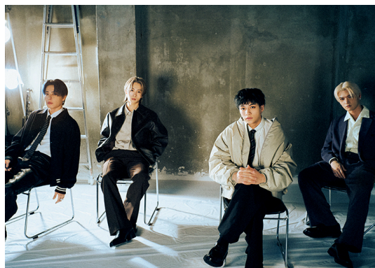
WOLF HOWL HARMONY