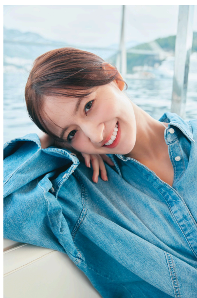
Sony Music Shop限定版