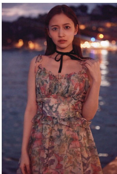
セブンネット限定版