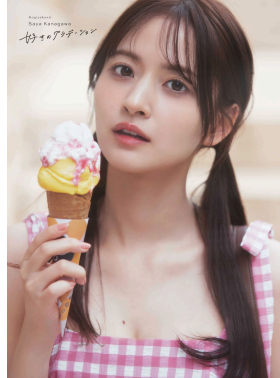
楽天ブックス限定版