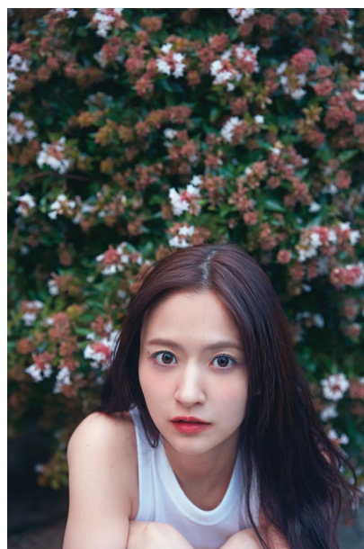
楽天ブックス限定版