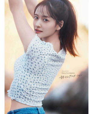
Sony Music Shop限定版