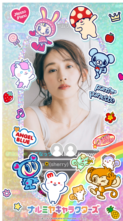
<「アニメーションアイテム」イメージ>