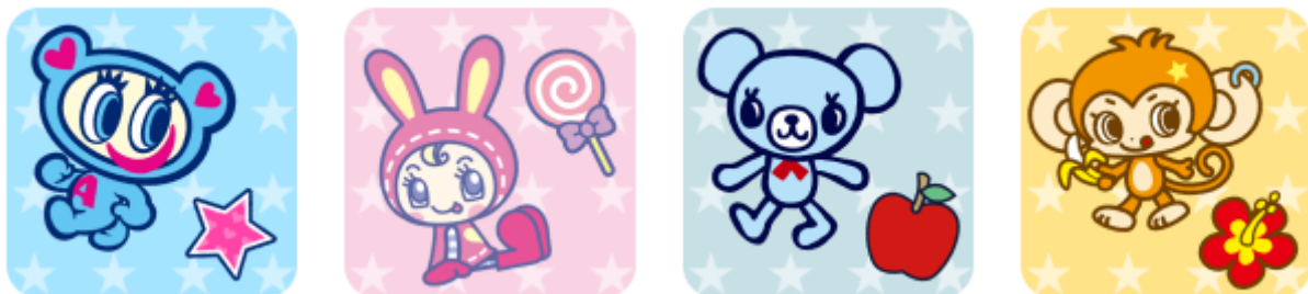
<「ナルミヤキャラクターズ ポイポイ」アイコン画像>

期間限定コラボアイテム第1弾として、「ナカムらくん」「ベリエちゃん」「ミントくん」「ルッキー」の中から好きなキャラクターを選んで送れるライブ配信限定アイテム「ナルミヤキャラクターズ ポイポイ」全4種が、4月28日(火)より登場しました。すでに多くのリスナーに使用いただいております、懐かしさと可愛さで思わずトークが弾むなど、大変ご好評いただいております。