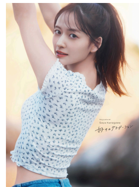
Sony Music Shop限定版