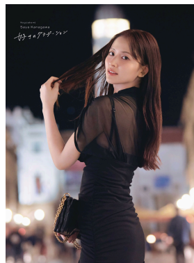
セブンネット限定版