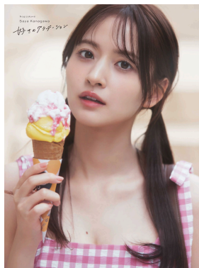
楽天ブックス限定版